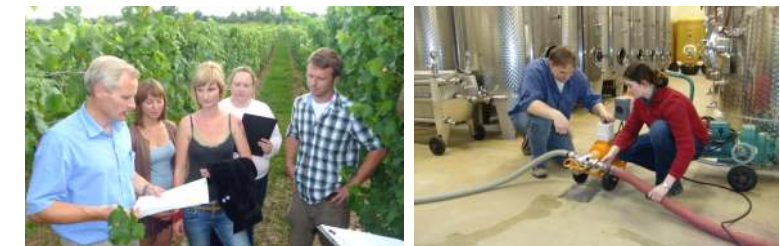
Verbindung von Praxis und Theorie in Kooperationsbetrieb und Studium

Der duale Studiengang verknüpft in einem attraktiven Zeitrahmen die berufliche und akademische Ausbildung. Die enge Zusammenarbeit der Partner leistet eine sehr starke Verzahnung von Kernkompetenzen aus Praxis, Wissenschaft und Forschung. Dies ermöglicht eine zielgerichtete und fundierte Ausbildung von Führungskräften für die nationale und internationale Weinwirtschaft. Professoren der Fachhochschulen und Wissenschaftler des DLR Rheinpfalz vereinen ein breites Spektrum an Fachwissen und praktischer Erfahrung, das in der Verzahnung von Berufsausbildung, Vorlesungen, Übungen, Laborarbeiten, Praxisprojekten, Seminaren und Exkursionen vermittelt wird. Dabei spielen innovative Lernmethoden und das besondere Lernklima, welches durch das enge Zusammenspiel zwischen Professoren, Studierenden und Ausbildungsbetrieben geschaffen wird, eine wichtige Rolle. Die engen Kontakte zu den Unternehmen, die im Rahmen von Praxisprojekten, Exkursionen und praktischen Übungen genutzt werden, runden das Profil des Studienangebots ab. Der Studienstandort ist Neustadt an der Weinstraße.