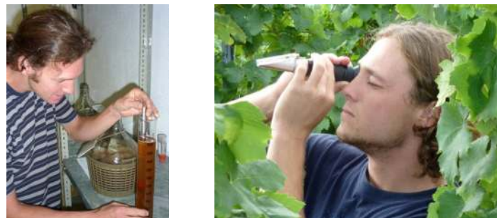
Anwendung erlernten Wissens und neuer Methoden