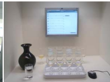
Prüfkabine für Weinsensorik